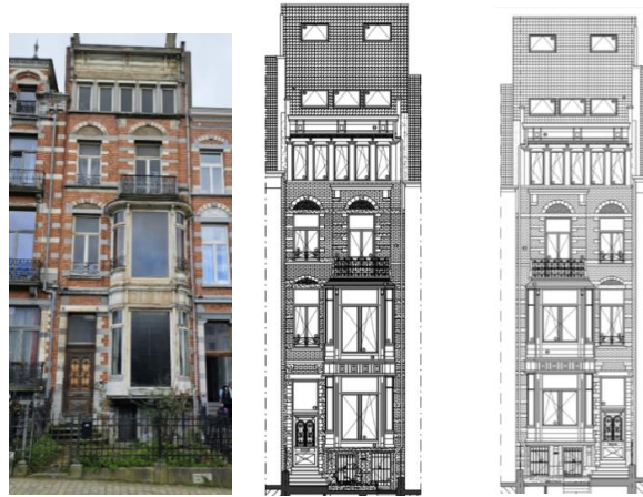
Façade avant – sit. existante, projet examiné par la CRMS en 2025 et projet modifié (extraits des dossiers de demande)