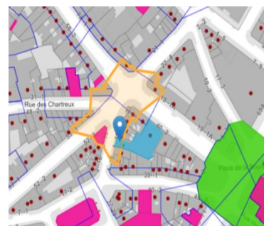
Erfgoedstatuut - Brugis

De aanvraag betreft de verbouwing van de beurschouwburg, die is ingeschreven op de wettelijke inventaris en waarvan de gevel aan de Karperbrug is gelegen in de vrijwaringszone van het gebouw 'le Saint-Géry'. Het project was ook al het voorwerp van een projectvergadering (04/04/025), waar de KCML bij aanwezig was. Het streeft naar een optimalisatie van de bestaande werking van het complex, waarbij de belangrijkste doelstellingen zijn: