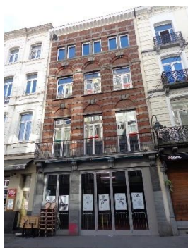
Gevels Orts en Karperbrug