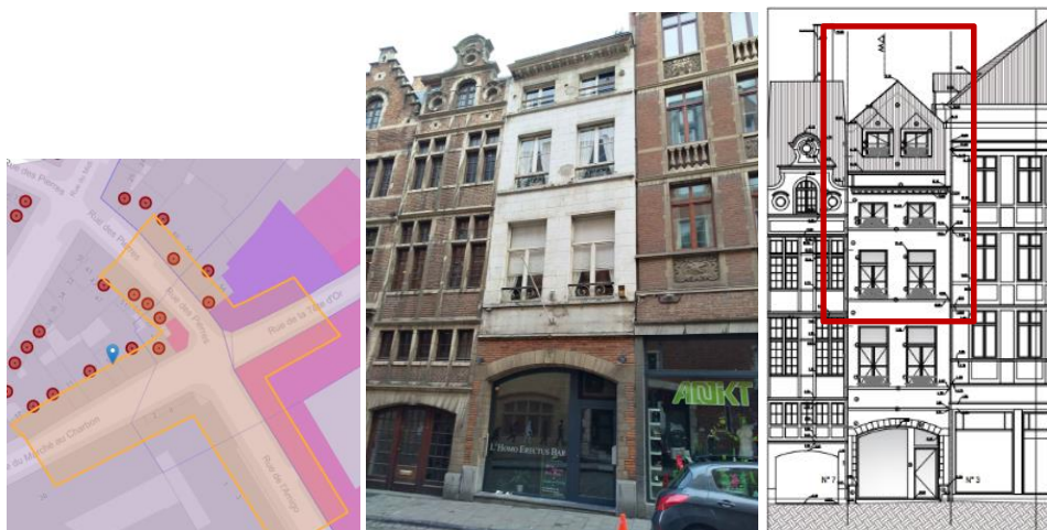
Localisation © Brugis, façade avant existante et projetée (extrait du dossier)

En réponse à votre courrier du 19/05/2026, nous vous communiquons l'avis émis par la CRMS en sa séance du 03/06/2026, concernant la demande sous rubrique.