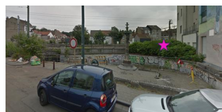
Vue vers le passage Chambon

Les travaux projetés n'auront pas d'impact défavorable sur les perspectives vers et depuis le passage Chambon.