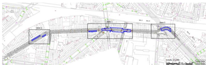
Interventions projetées – Image tirée du dossier de demande