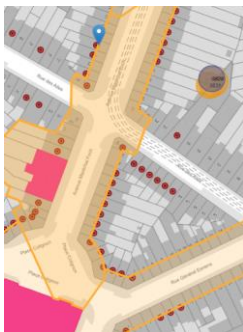
Situation patrimoniale

En réponse à votre courrier du 19/05/2026, nous vous communiquons l'avis émis par la CRMS en sa séance du 03/06/2026, concernant la demande sous rubrique.