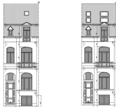
Façade avant. Situation existante et projetée – extraits du dossier

Les interventions visées par la demande ne portent pas atteinte aux perspectives vers et depuis l'Hôtel communal ni à celles des maisons Art nouveau situées à proximité. En ce qui concerne les aménagements intérieurs, la CRMS demande de préserver autant que possible les intérieurs et les éléments de décor d'origine encore présents et présentant un intérêt patrimonial.