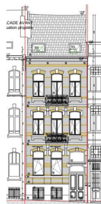
Façade avant. Situation projetée – extrait du dossier

Les interventions en façade avant n'ont pas d'impact négatif sur les perspectives vers et depuis le bien classé. Le remplacement des châssis en PVC du deuxième étage par de nouveaux châssis en bois, ainsi que la remise en état de la corniche d'origine par l'enlèvement du revêtement en PVC, contribuent à la mise en valeur de cette façade inscrite à l'inventaire légal. Les aménagements prévus en façade arrière n'appellent pas de remarques d'ordre patrimonial. En ce qui concerne l'intérieur, la CRMS demande de préserver les décors existants présentant un intérêt patrimonial.