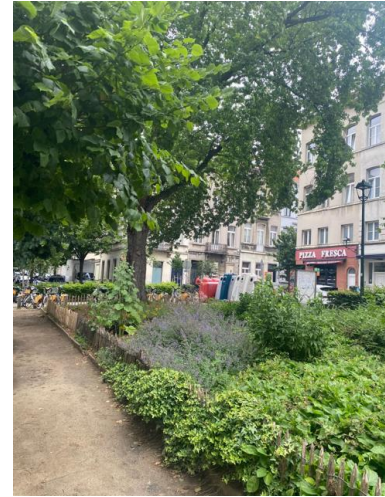
Photos de la situation actuelle de la Place Loix. Photos CRMS juin 2026

Dans ce contexte, l'implantation précise du buste n'apparaît plus clairement et la composition végétale proposée, relativement formelle, semble moins adaptée aux caractéristiques actuelles du lieu. La CRMS demande dès lors qu'en concertation avec la commune de Saint-Gilles, l'emplacement exact de la statue soit clarifié et que son accompagnement paysager soit réétudié plus finement afin de mieux s'intégrer au cadre existant. Une attention particulière devrait être portée à l'implantation des pommiers projetés, de manière à les incorporer plus harmonieusement dans la composition actuelle de la place.