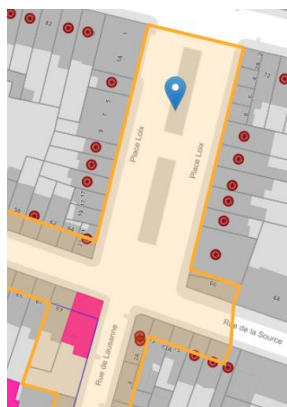
Situation patrimoniale

La Place Loix est comprise dans la zone de protection de l'Ancienne maison et atelier du peintre Hennebicq, située Rue de Lausanne n°1.