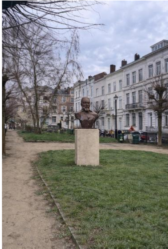
Photomontage projeté du buste. Image extraite du dossier

Toutefois, la CRMS, qui s'est rendu sur place le 2 juin dernier, a constaté que cet espace a fait l'objet d'un renfort de végétalisation et de biodiversité important dont le dossier ne reflète pas fidèlement la situation.