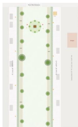
Implantation projetée de la composition