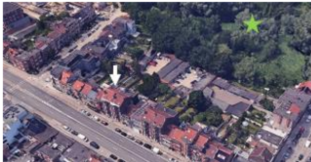
Localisation du bien

Les actes et travaux qui font l'objet de la demande sont sans impact sur les perspectives vers et depuis le site classé du Scheutbos qui s'étend à l'arrière de l'immeuble. La demande n'appelle donc pas de remarques d'ordre patrimonial.