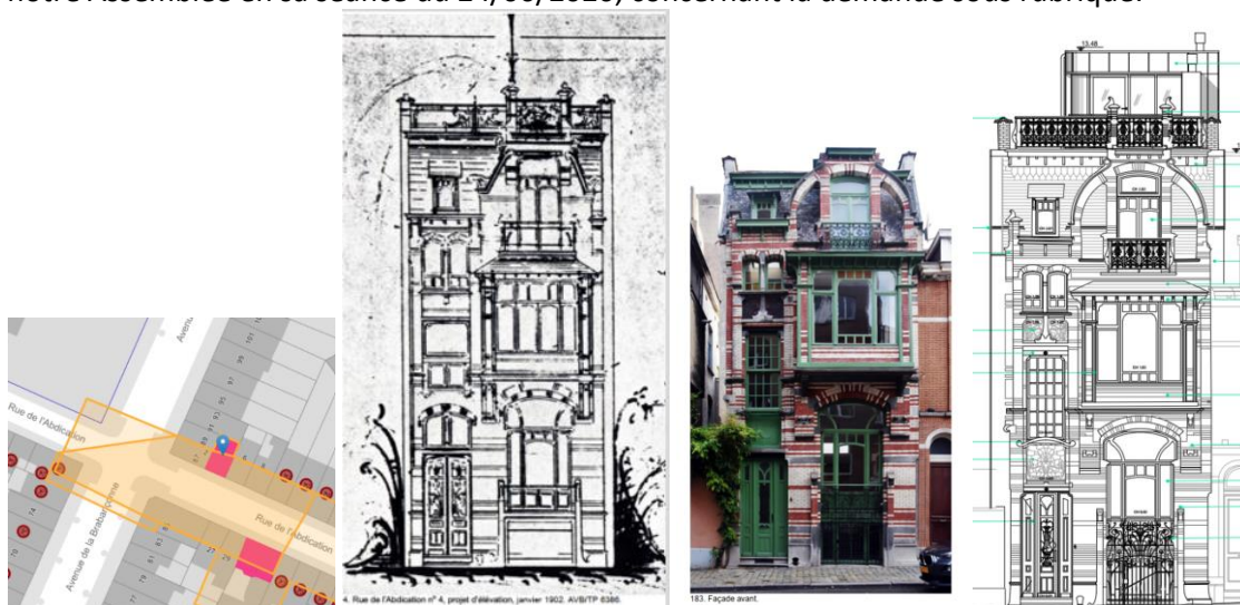
Localisation © Brugis, élévation du permis de bâtir en 1902 (AVB/TP6386), vue actuelle et situation projetée (extraits du dossier)

En réponse à votre courrier du 03/06/2026, nous vous communiquons l'avis conforme favorable émis par notre Assemblée en sa séance du 24/06/2026, concernant la demande sous rubrique.