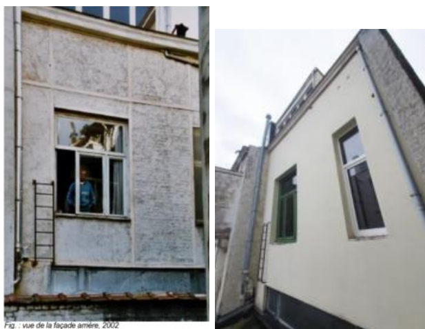
Vues de la façade arrière en 2002 et aujourd'hui (extraits du dossier)

La façade présente de nombreux désordres, principalement au dernier étage, dus aux infiltrations d'eau. Des dégradations d'enduits et de moulures intérieures peuvent être observées à l'étage sous combles. Le plafonnage sous cet étage a été partiellement enlevé pour constater l'état des poutres en sapin qui ont aussi subi les infiltrations, dû à un mauvais entretien de la plateforme bitumineuse créée entre 1950 et 1970, ainsi que ses raccords avec le versant arrière en tuiles.