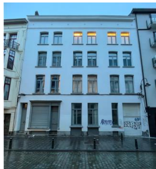
Façade avant (extrait du dossier)

Les travaux réalisés n'ont pas d'impact négatif sur les perspectives vers et depuis le cinéma Pathé-Palace. Le choix de menuiseries en bois peint dans une teinte gris clair est qualitatif et s'intègre correctement dans la façade néoclassique. La CRMS demande toutefois d'améliorer le traitement de l'entrée cochère et de privilégier une porte de garage en bois (pas de PVC).