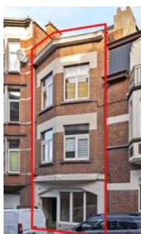
Foto van de voorgevel uit de aanvraag