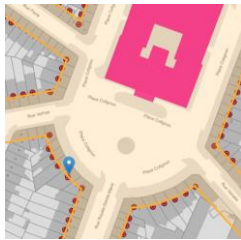
Localisation du bien

En réponse à votre courrier du 28/05/2026, nous vous communiquons l'avis émis par la CRMS en sa séance du 24/06/2026, concernant la demande sous rubrique.