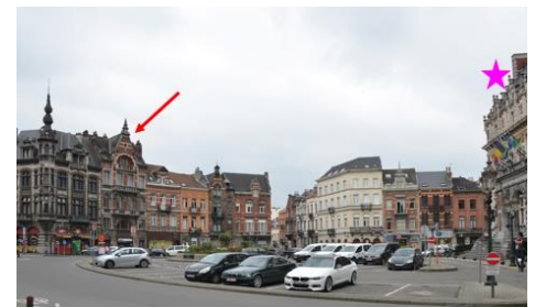
Localisation du bien

L'aménagement du logement aux niveaux supérieur du bien ne porte pas atteinte aux perspectives vers et depuis l'hôtel communal ni à la remarquable scénographie urbaine qui entoure le monument classé. Le projet n'implique aucune modification à la composition de la façade avant et n'appelle dès lors pas de remarques d'ordre patrimonial, pour autant que le châssis de remplacement prévu au balcon central adopte une typologie traditionnelle, en cohérence avec les caractéristiques du bien (profils traditionnels).