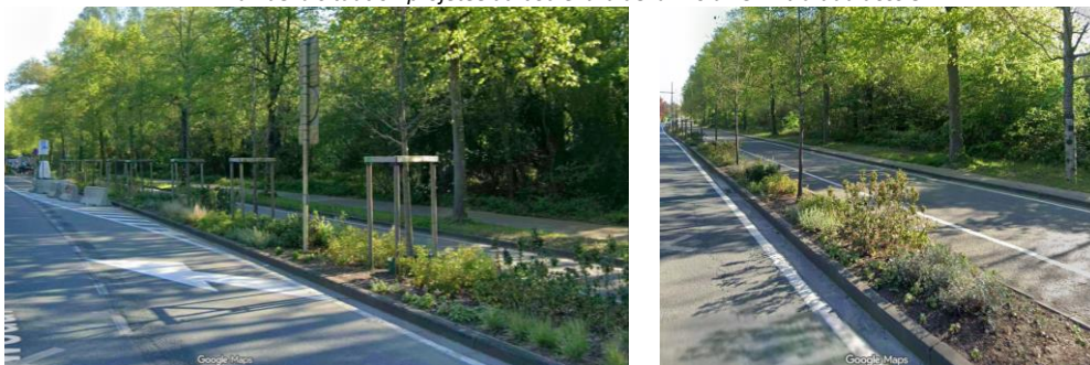
Photos du boulevard de la Woluwe et des aménagements déjà réalisés.