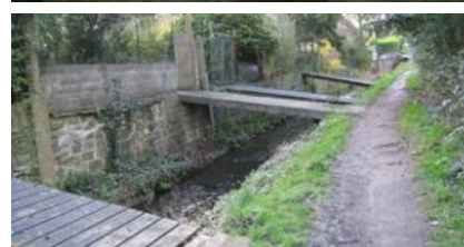
En haut photo du Hof-ter-Musschen. En bas, photo du chemin du Vellemolen.

La demande vise à régulariser et pérenniser les aménagements tests mis en place depuis le 31 août 2024 sur la section du boulevard de la Woluwe située entre le carrefour avenue Emile Vandervelde/boulevard de la Woluwe et la limite régionale. Sur la bande latérale est, la circulation automobile et le stationnement ont été supprimés au profit d'une piste cyclable bidirectionnelle, tandis que les arrêts de bus ont été déplacés sur la berme centrale. Sur la bande latérale ouest, des aménagements ont été réalisés afin de réduire la vitesse des véhicules motorisés tout en maintenant une bande de circulation locale et une piste cyclable unidirectionnelle. Les carrefours situés dans le périmètre du projet ont aussi été réaménagés. La réfection des trottoirs ne fait pas partie de la présente demande de permis d'urbanisme à l'exception de certaines interventions ponctuelles au droit