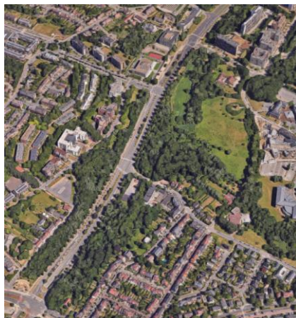
Vue aérienne du boulevard de la Woluwe