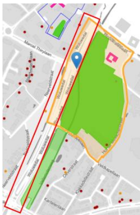
Périmètre du projet et Situation patrimoniale ©Brugis

Le périmètre du projet est partiellement compris dans la zone de protection de la zone marécageuse du Hof-ter-Musschen, classé comme site par AG du 09/06/1994. Il longe aussi le Chemin du Vellemolen, inscrit comme site sur la liste de sauvegarde par AG du 12/02/1998.