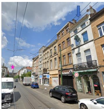
Photo de l'immeuble et de la maison communale classée.

En réponse à votre courrier du 30/06/2026, nous vous communiquons l'avis émis par la CRMS en sa séance du 08/07/2026, concernant la demande sous rubrique.