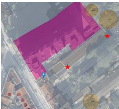
Situation patrimoniale du bien et localisation des travaux

En réponse à votre courrier du 12/06/2026, nous vous communiquons l'avis émis par la CRMS en sa séance du 24/06/2026, concernant la demande sous rubrique.