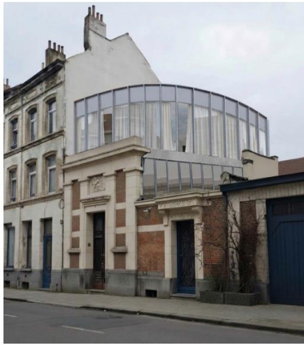
Figure 9. DAG - PRINCIPALEBILD