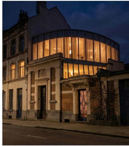
Figure 10. NACHT - PRINCIPALEBILD