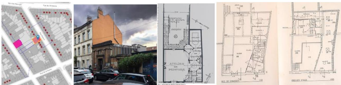
Erfgoedlocatie bestaande toestand, plannen van de oorspronkelijke en de bestaande toestand (documenten uit de aanvraag)

De aanvraag betreft de optopping van het voormalige kunstenaarsatelier van de schilder Herman Courtens (1884-1956) gelegen aan de Braemtstraat 97-99 in Sint-Joost-ten-Node. De straatgevel, de bedaking - uitgezonderd die van het lagere gedeelte achteraan - en het noordelijke atelierraam boven de vestibule zijn als monument ingeschreven op de bewaarlijst bij besluit van 03/07/1997. De straatgevel werd als monument beschermd bij besluit van 30/06/2005.